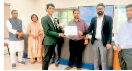
ठीक उसी तर्ज पर यहां भी दोनों पक्षों ने अपने-अपने तर्कों की महत्ता साबित करने का भरपूर प्रयास किया। इस पूरे आयोजन और संसदीय कार्यवाही को लेकर छात्रों में भारी उत्साह देखने को मिला।

यूथ पार्लियामेंट में हिस्सा लेने वाले छात्र अपने-अपने विषयों पर गहन रिसर्च करके पहुंचे थे। उन्होंने हवा-हवाई बातों के बजाय ठोस तथ्यों और तर्कों के आधार पर अपनी बात रखी, जिससे विषय की गंभीरता और भी स्पष्ट हुई। इस आयोजन में एक तरफ विपक्ष तो दूसरी तरफ सरकार के मंत्रियों की भूमिका में छात्र नजर आए। जिस तरह देश की संसद में विधिवत और गरिमापूर्ण चर्चा होती है, संसद में विधिवत और गरिमापूर्ण चर्चा होती है, ठीक उसी तर्ज पर यहां भी दोनों पक्षों ने अपने-अपने तर्कों की महत्ता साबित करने का भरपूर प्रयास किया। इस पूरे आयोजन और संसदीय कार्यवाही को लेकर छात्रों में भारी उत्साह देखने को मिला।